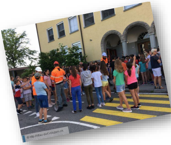
Bild: Projekttag Schulhausrenovation

Ab Oktober 2019 wird ein Architekturwettbewerb ausgeschrieben. Im Mai 2020 prüft eine Jury die Eingaben und entscheidet, mit welchem Projekt die Stadt weiterarbeiten kann. Sie werden die Gelegenheit erhalten, die Eingaben und das Siegerprojekt vor Ort zu sehen.